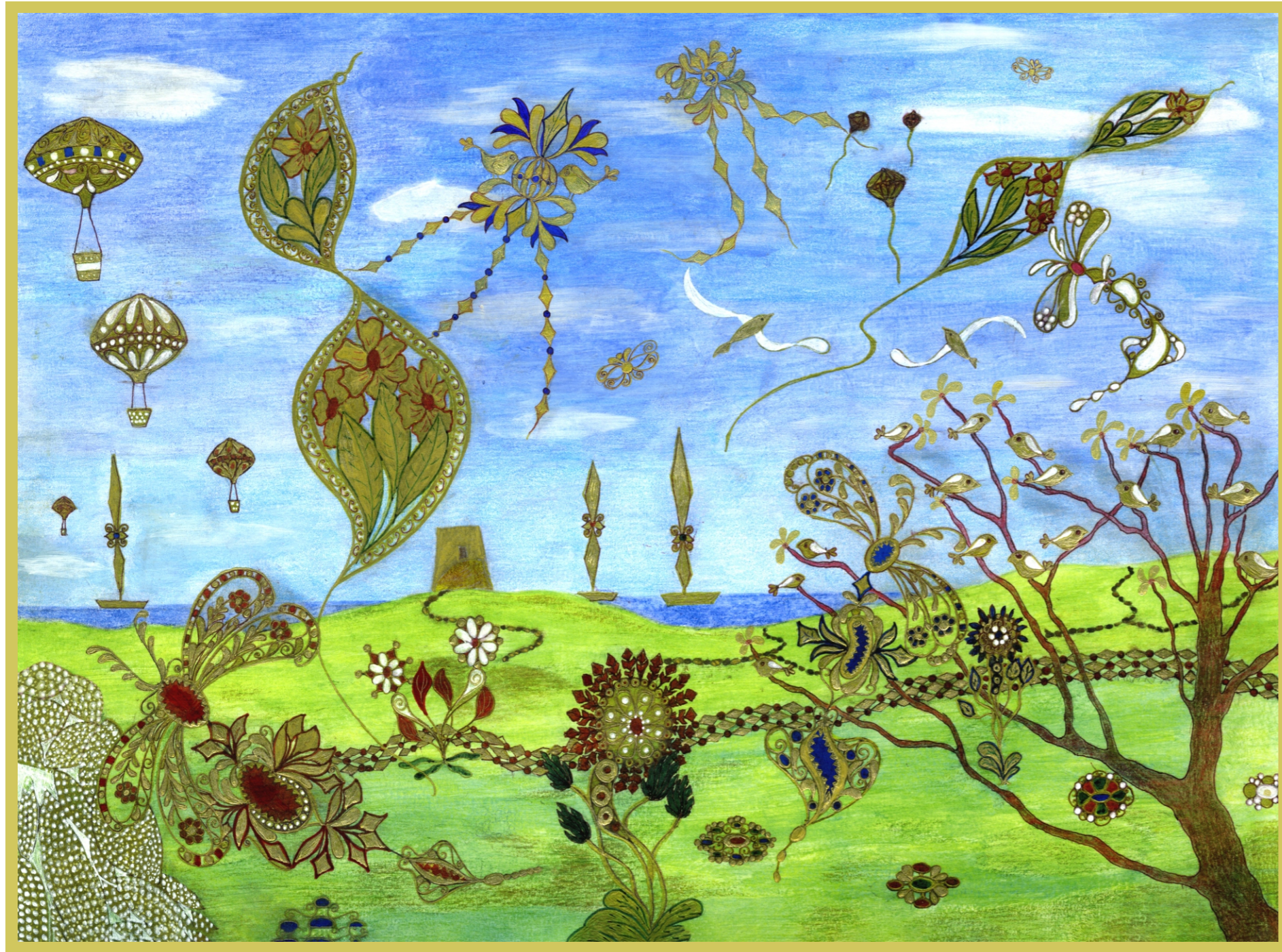
“Gioielli in libertà” di Chicca Corona

8 Marzo Cagliari - 5 Aprile Cagliari - 10 Maggio Sardara